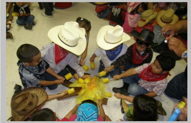
Cowboy Day / Dia De Vaquero