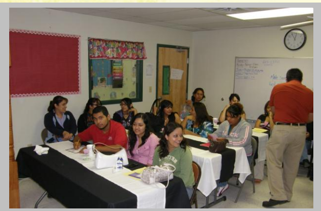
Parent Meeting / Junta de Padres