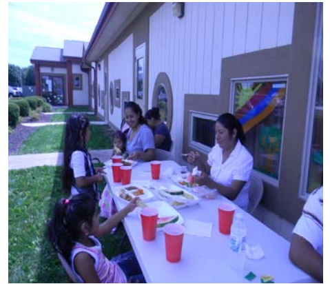
DISFRUTANDO DE COMIDAS, MUSICA Y OTROS EVENTOS. ENJOYING FOOD, MUSIC AND OTHER EVENTS.